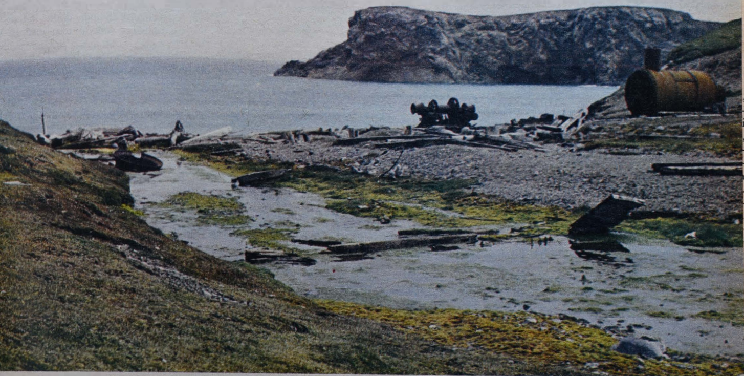
De mest synliga avsnitt ur Björnöns historia rostar långsamt ner vid stränderna: här är några lämningar från valrosstidens trunkokeri.